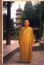
守唐僧舍利塔的护国兴教寺僧人。▲这是西安郊外的护国兴教寺,看